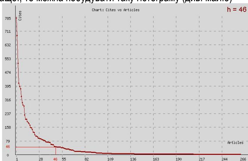
Мал.3. Статтю №46 процитували 46 разів - це і є h -індекс de Lange